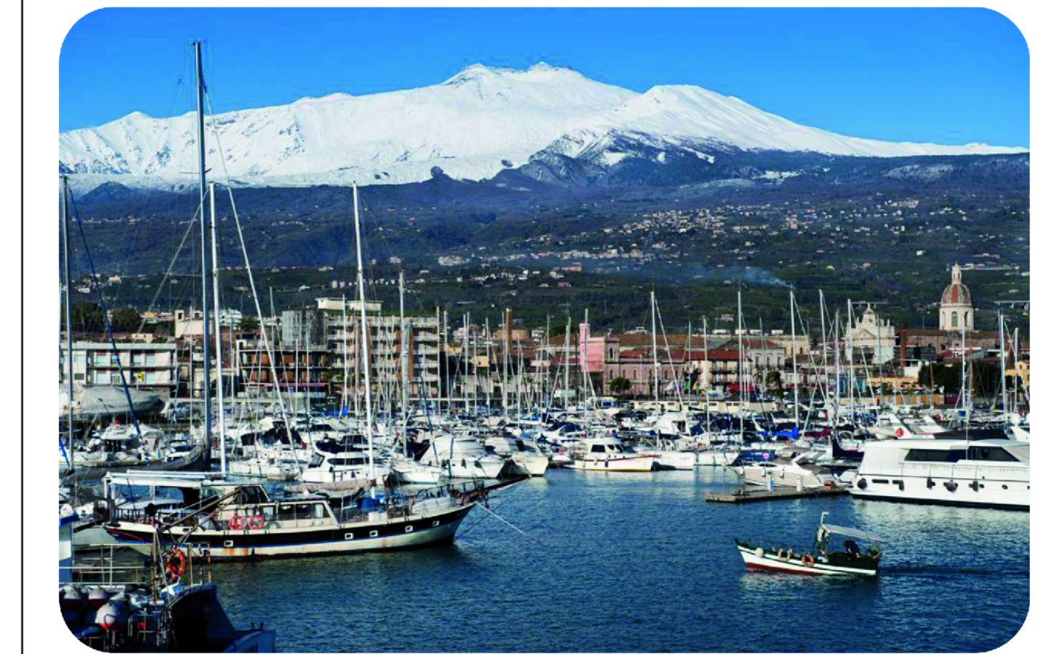
Tavola 6B - Rischio Tsunami