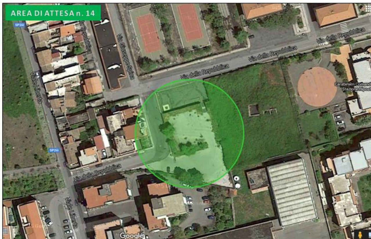
Largo Salvo D'Acquisto via della Repubblica