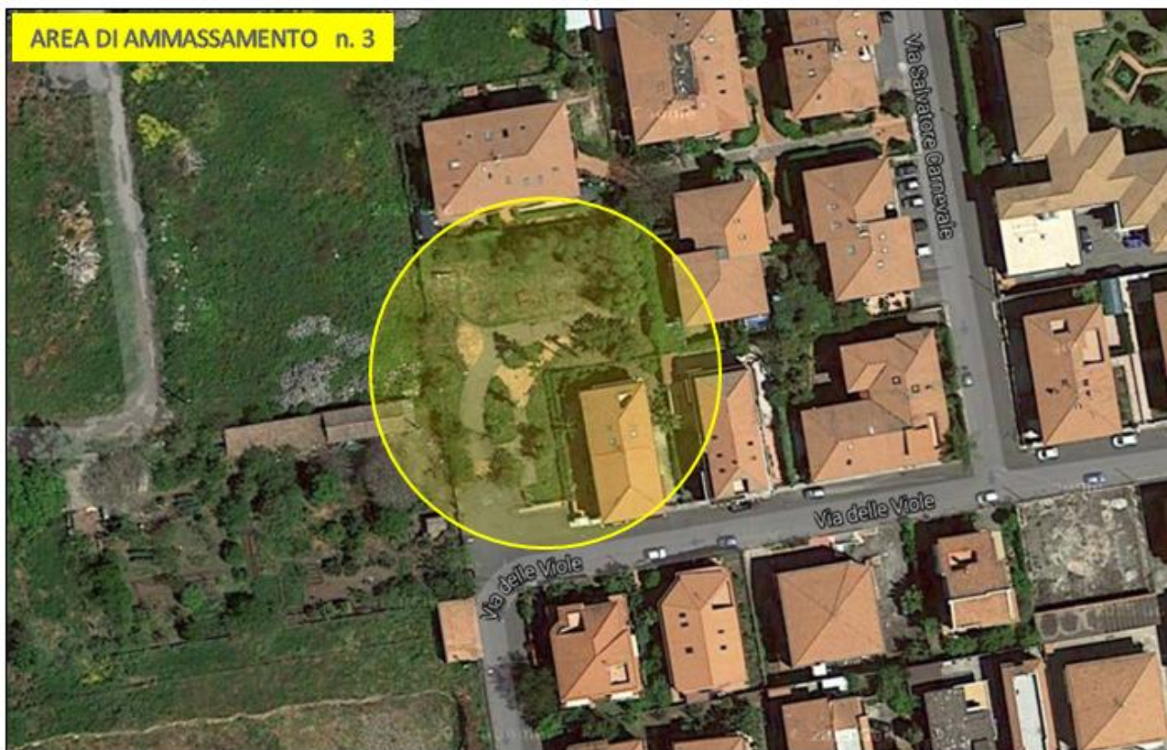
Parco On. Giuseppe Russo via delle Viole (Torre Archirafi)