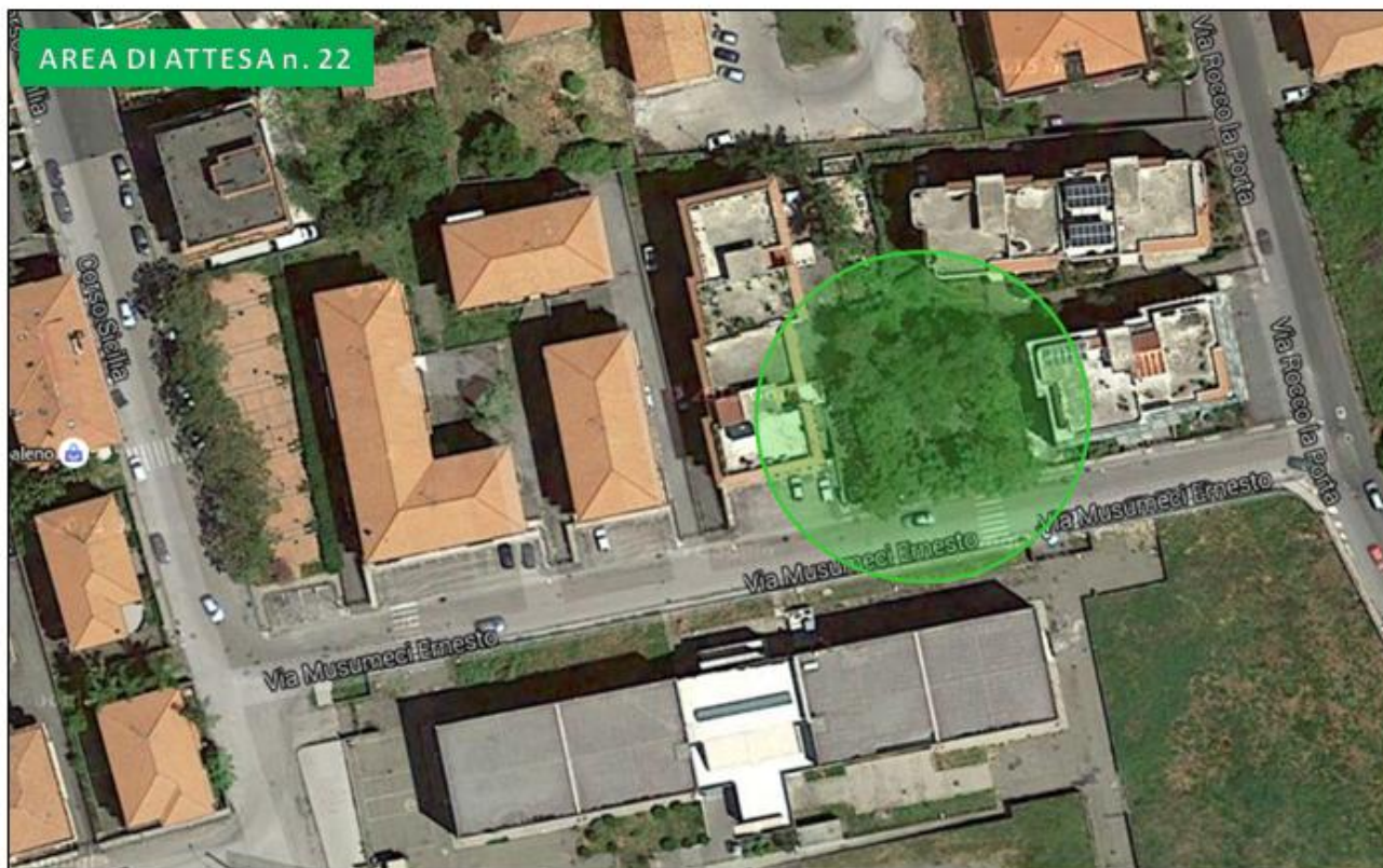
Villetta via Ernesto Musumeci