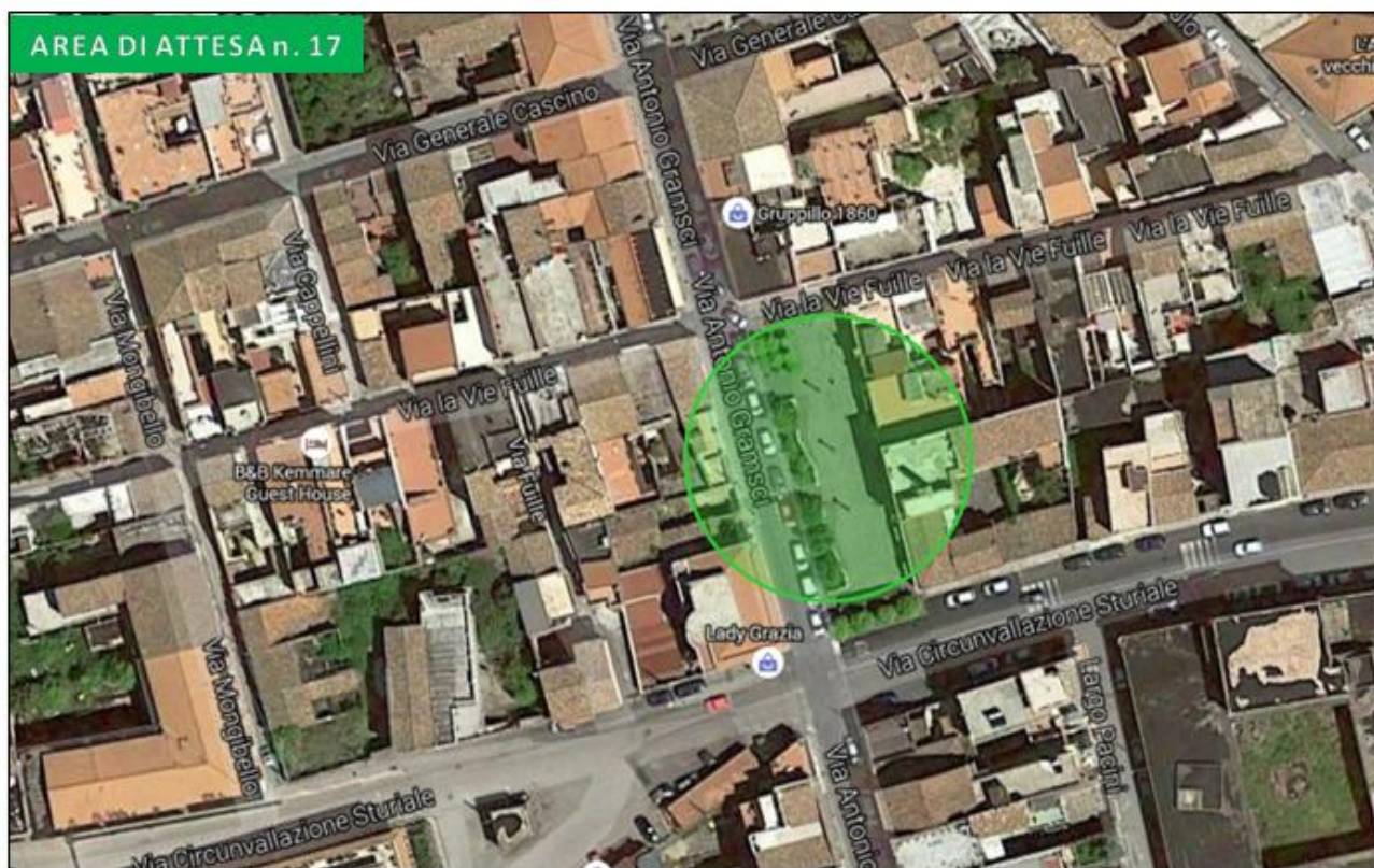
Piazza A. Maiorana via Gramsci