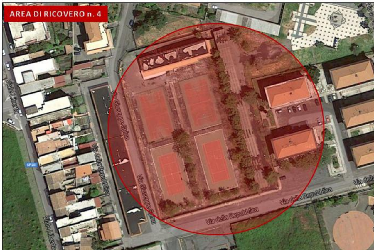
Via della Repubblica - campi da tennis