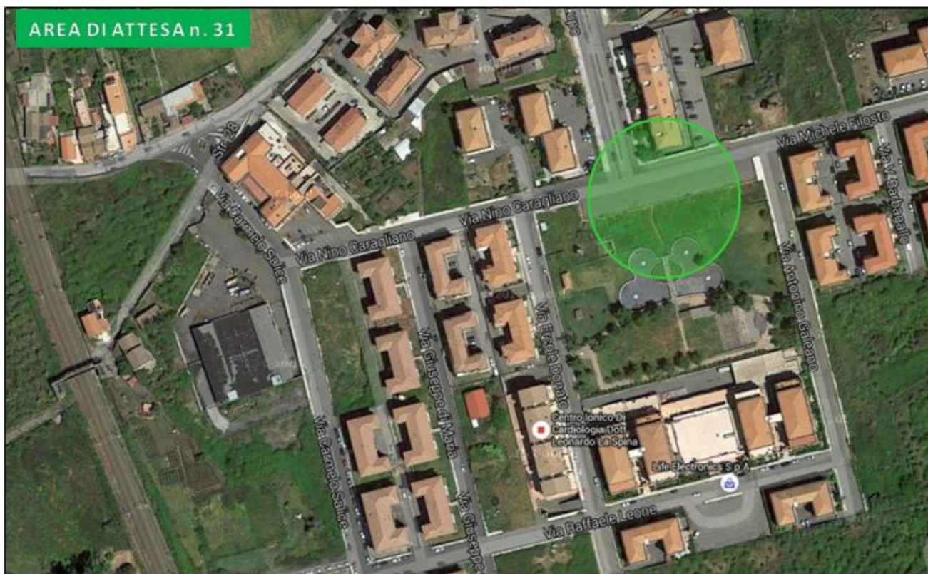
Slargo via Nino Caragliano