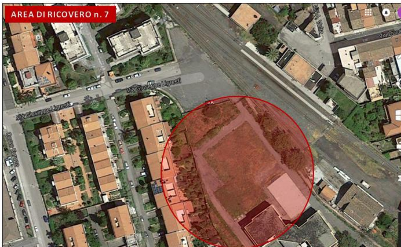
Scuola media via Ligresti