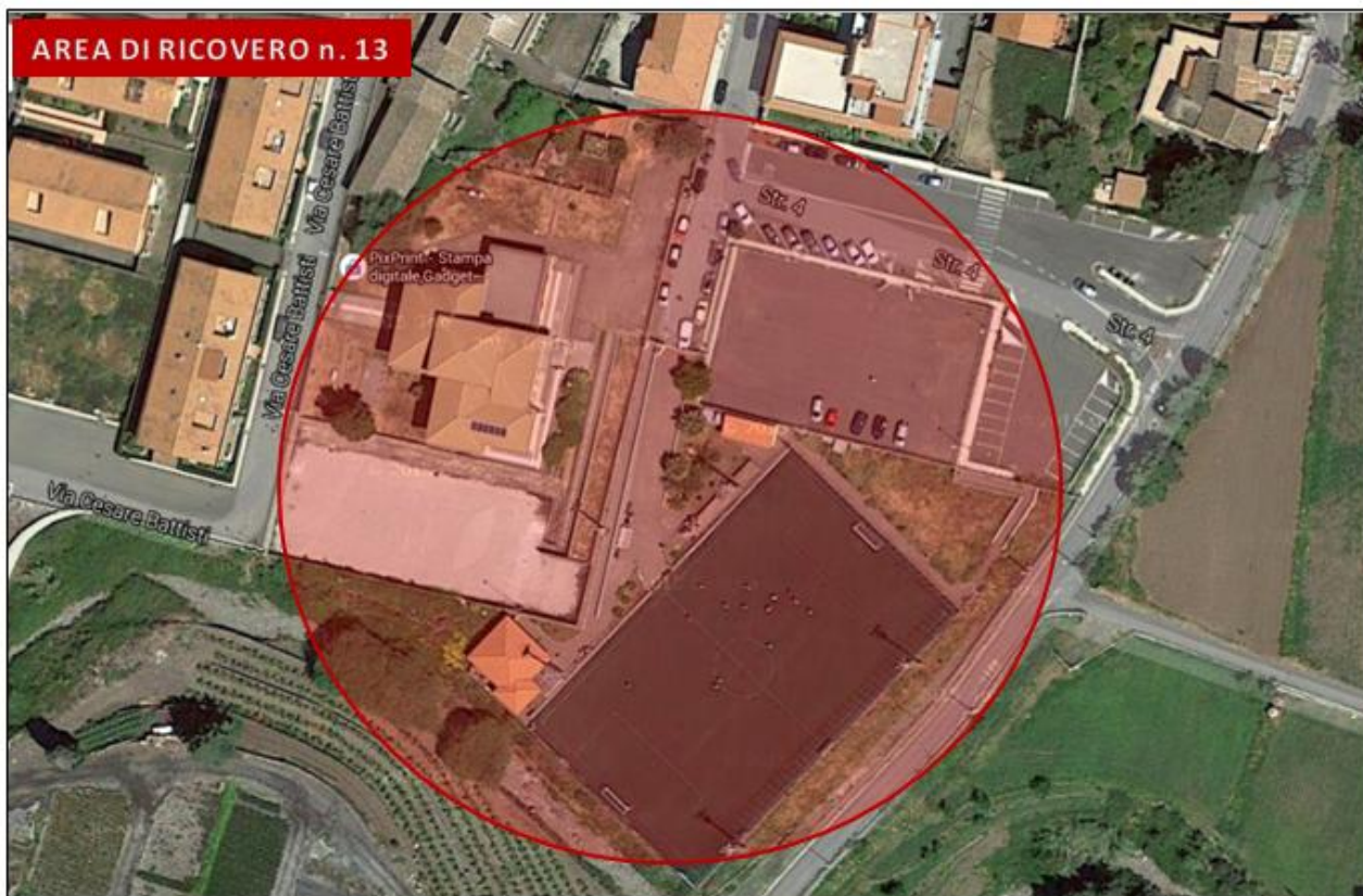
Scuola media Carrubba e campetti annessi