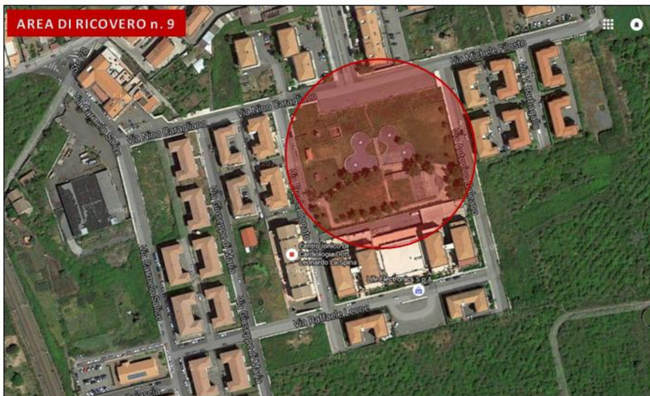
Parco P. Mattarella