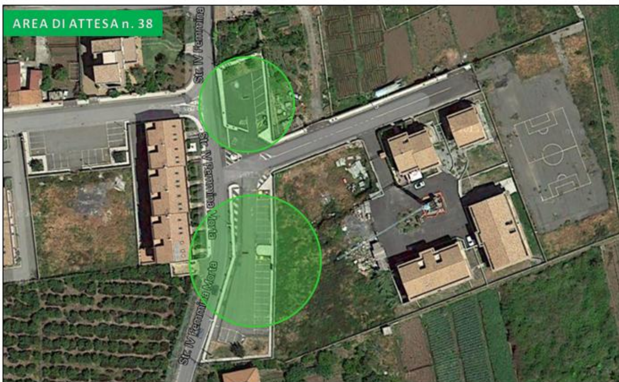
Parcheeggio SP 2/I-II (Archi)