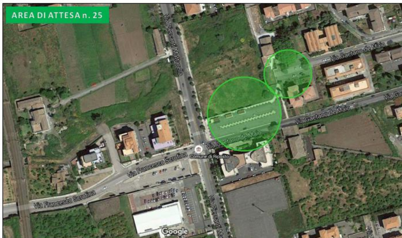
Parcheggi via Calabretta via De Maio