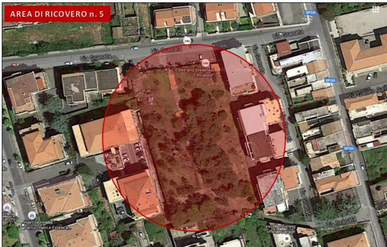
Parco giochi Falcone Borsellino