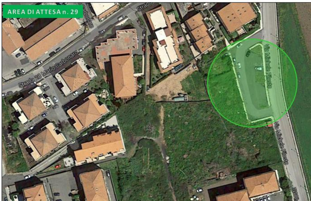
Parcheggio via Filosto