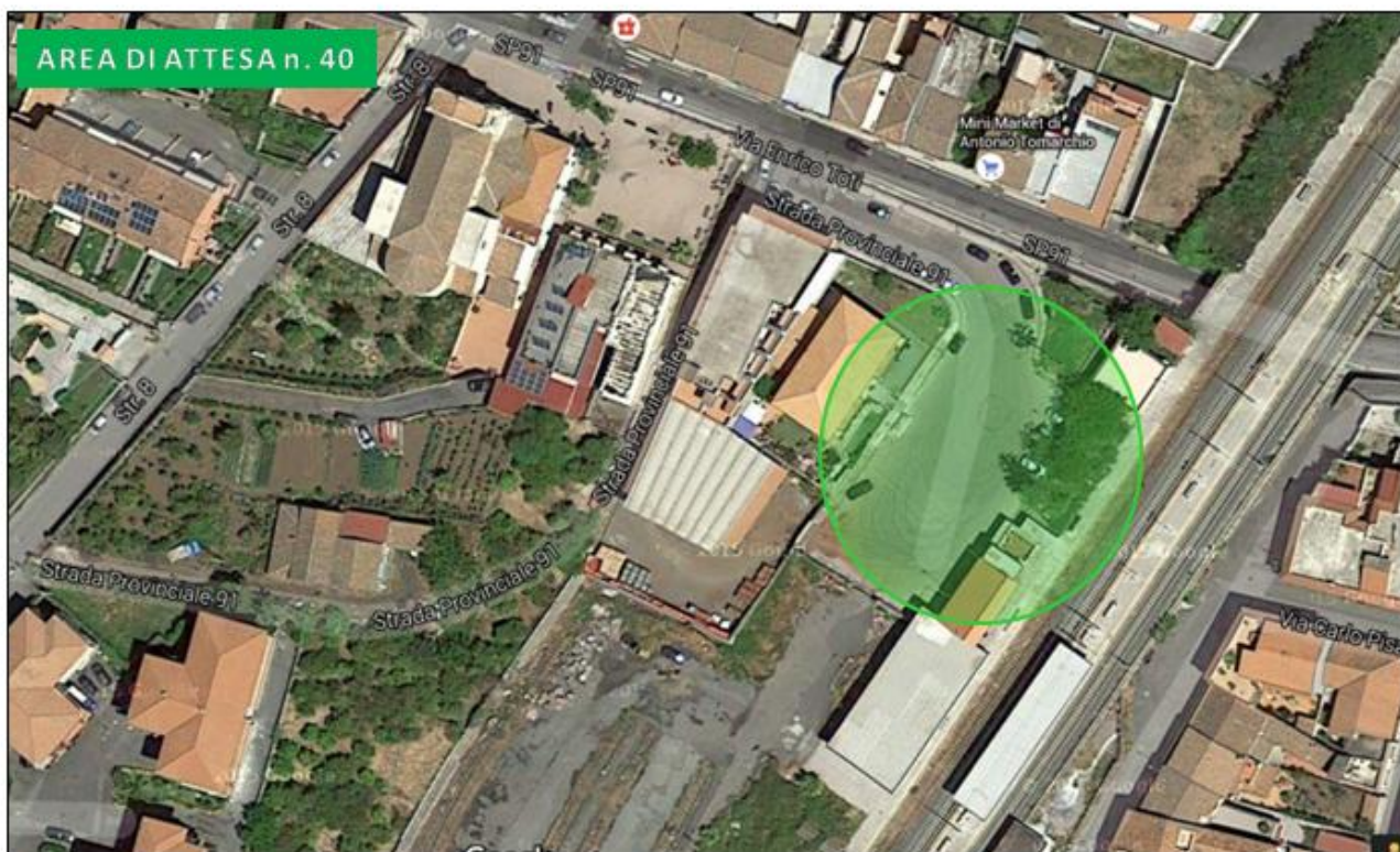
Piazza Stazione (Carruba)