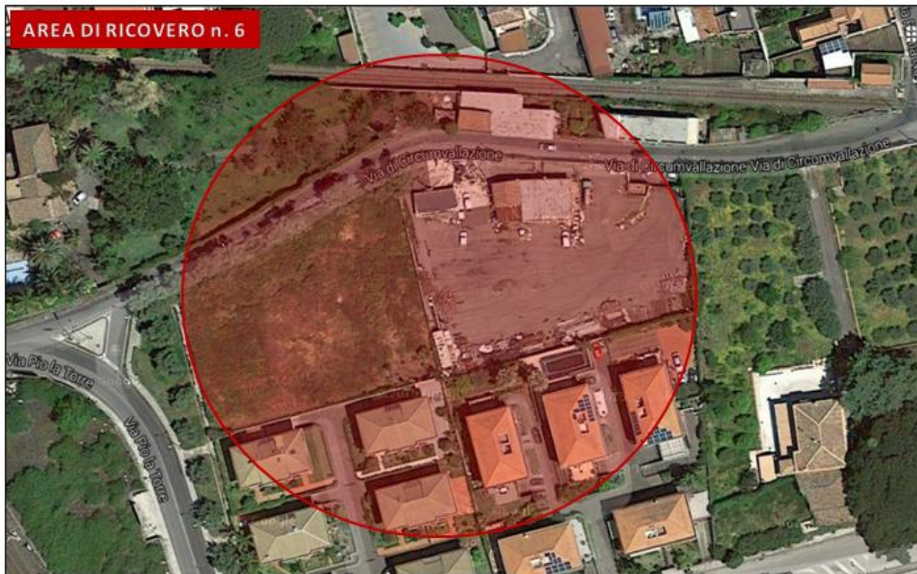
Area Puglisi Cosentino