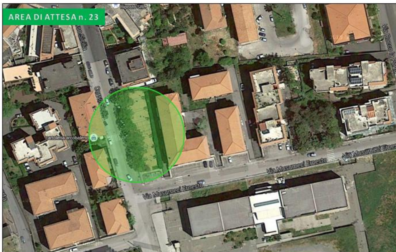
Villetta Corso Sicilia – via Ernesto Musumeci