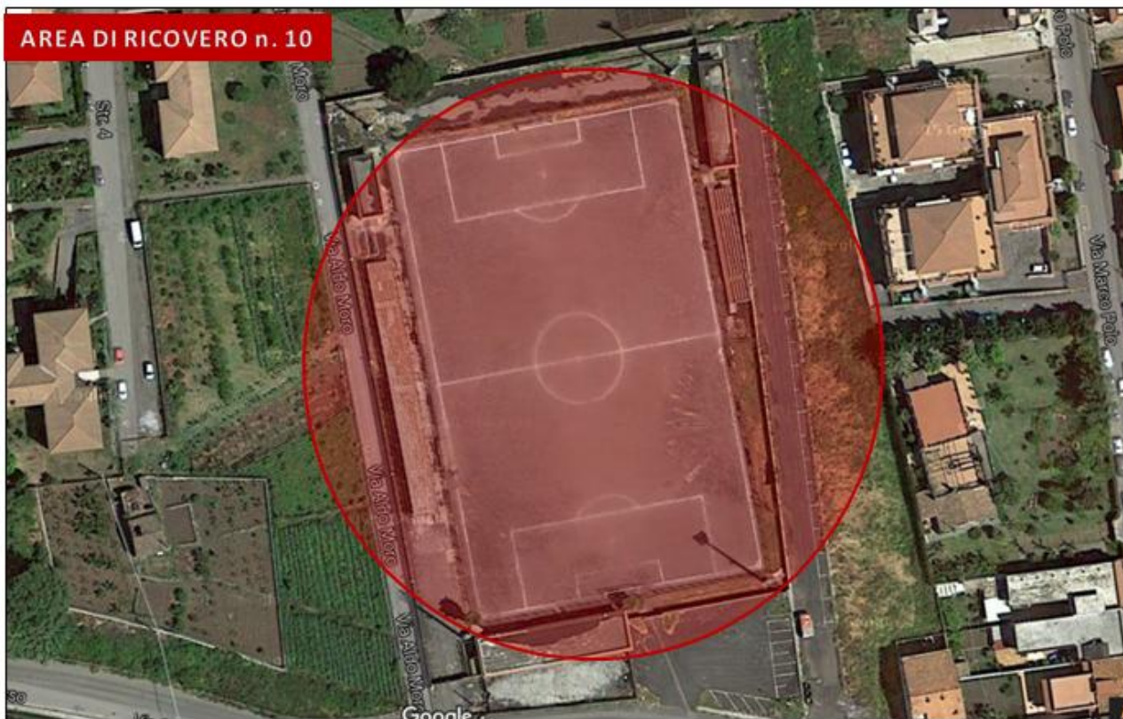
Campo sportivo via S. Grasso (Torre Archirafi)