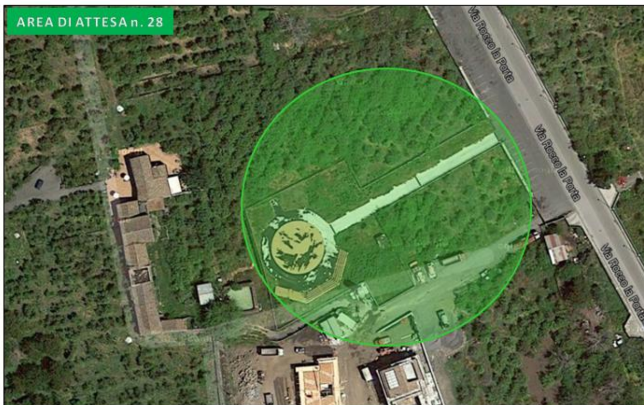
Villetta via Patti – via Rocco La Porta