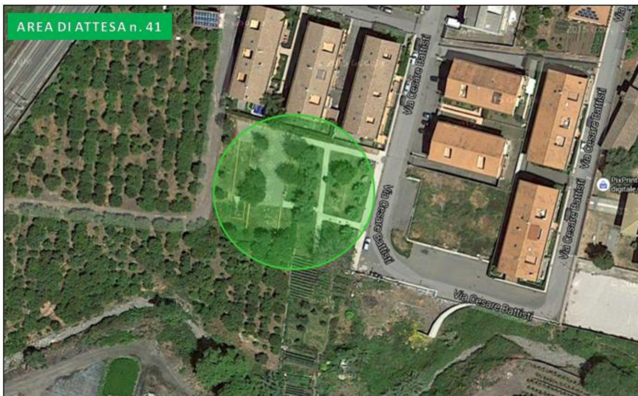
Villetta via Cesare Battisti (Carruba)