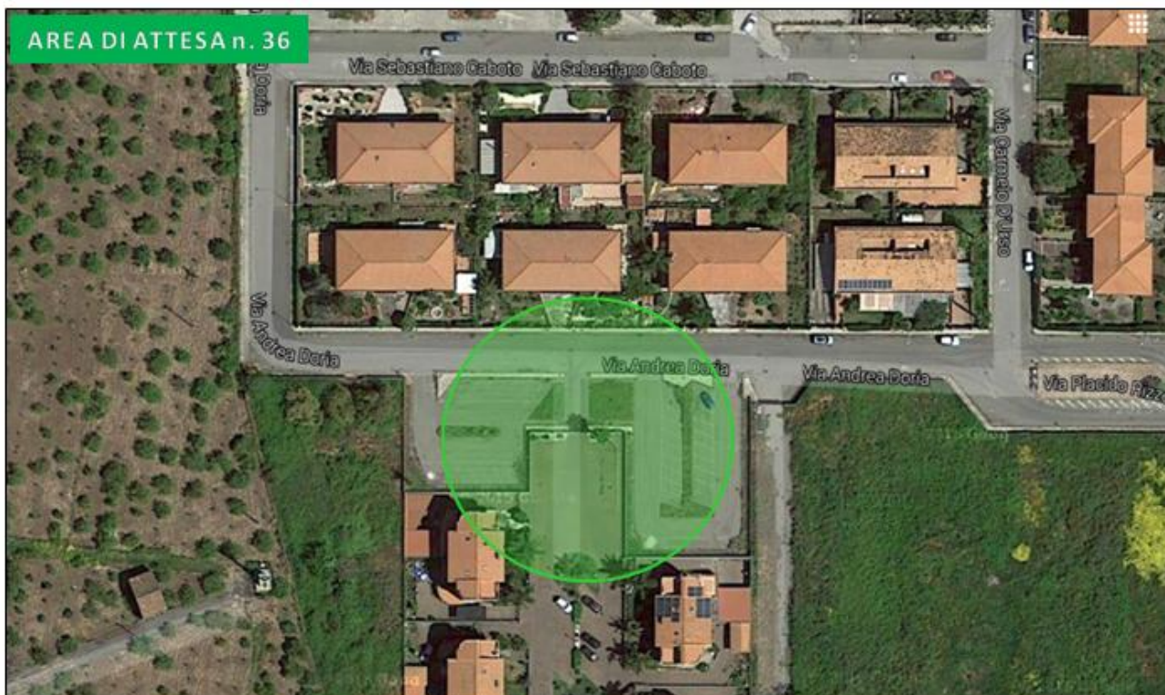
Villetta via Andrea Doria (Torre Archirafi)