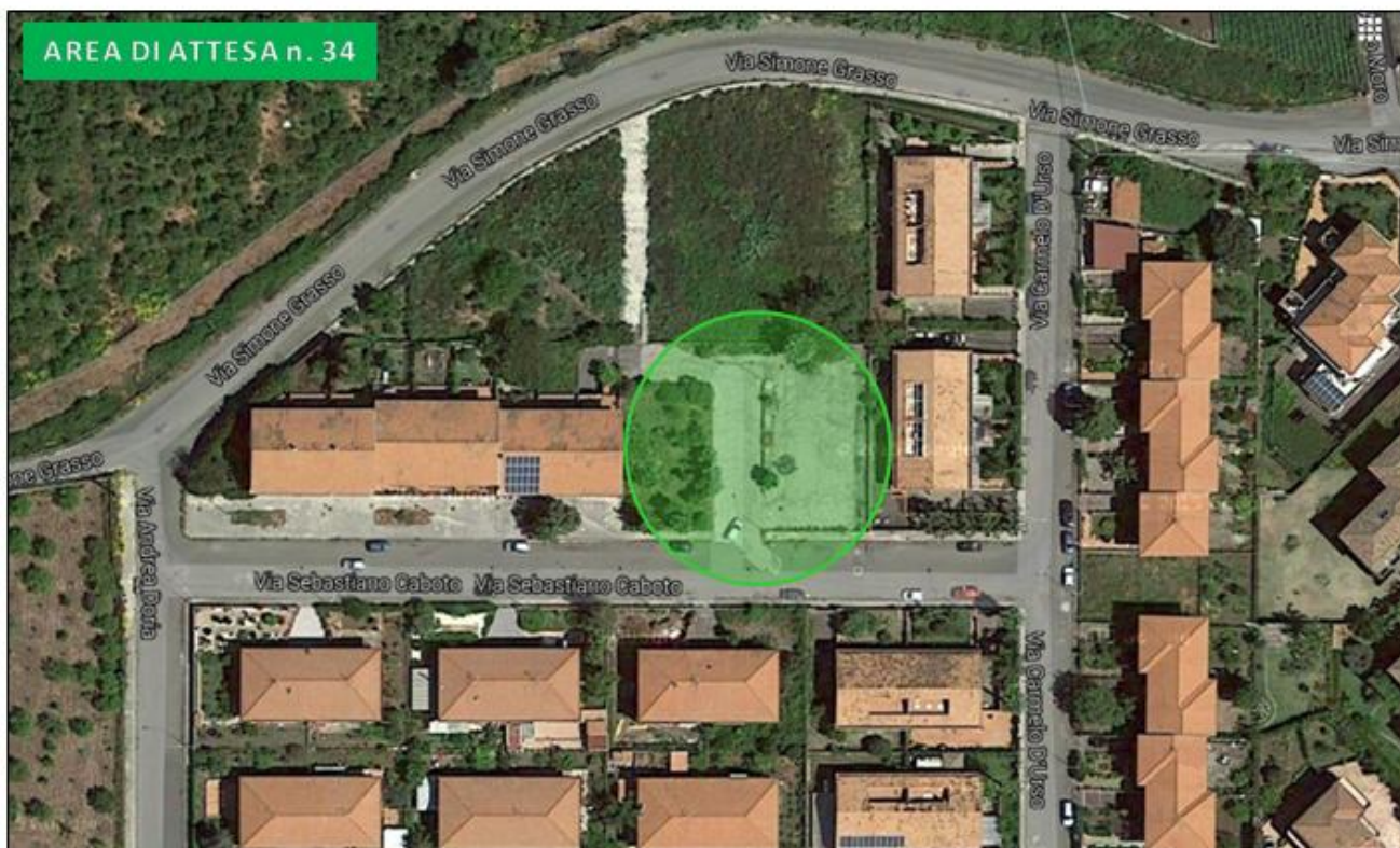
Parcheggio via Sebastiano Caboto (Torre Archirafi)