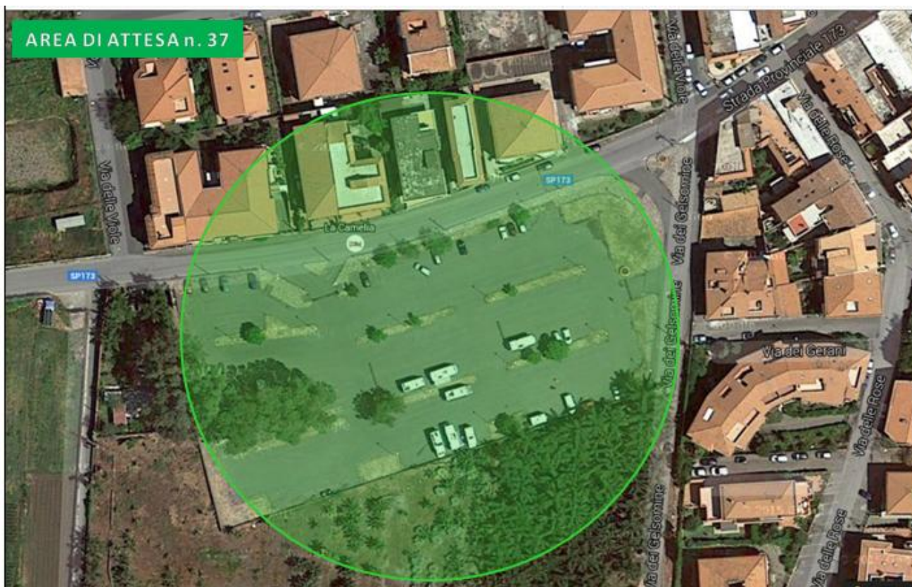
Parcheggio Sebastiano Russo (Torre Archirafi)