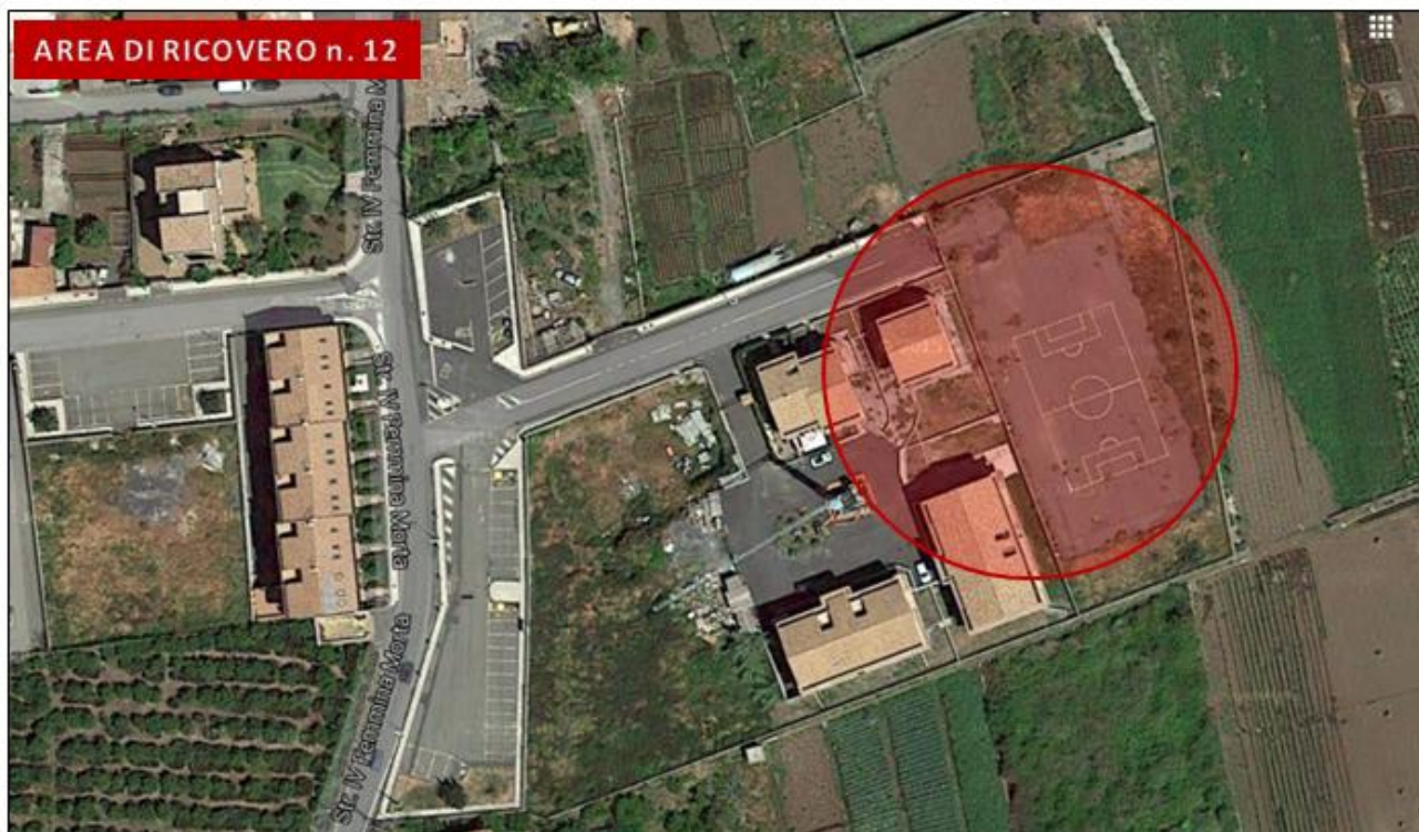
Campetto via Alizzi (Archi)