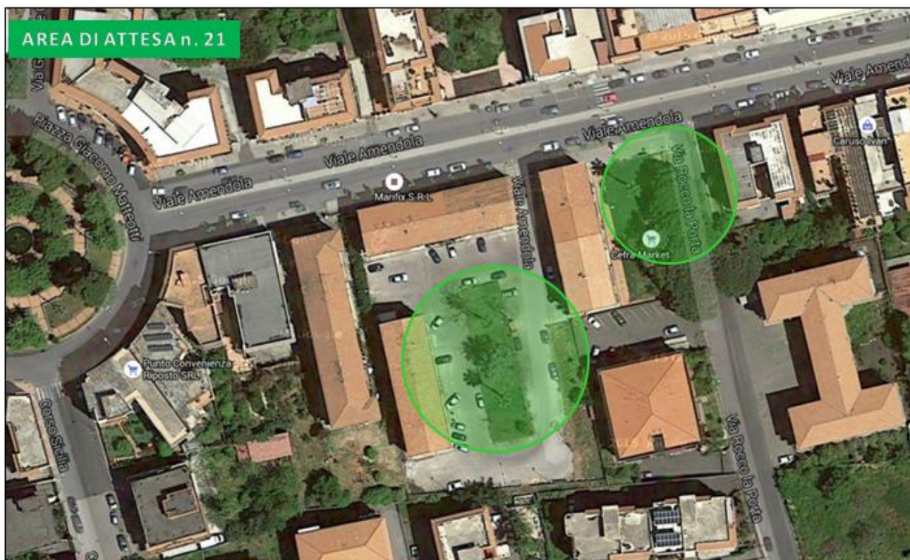
Villetta via Amendola – area antistante alloggi