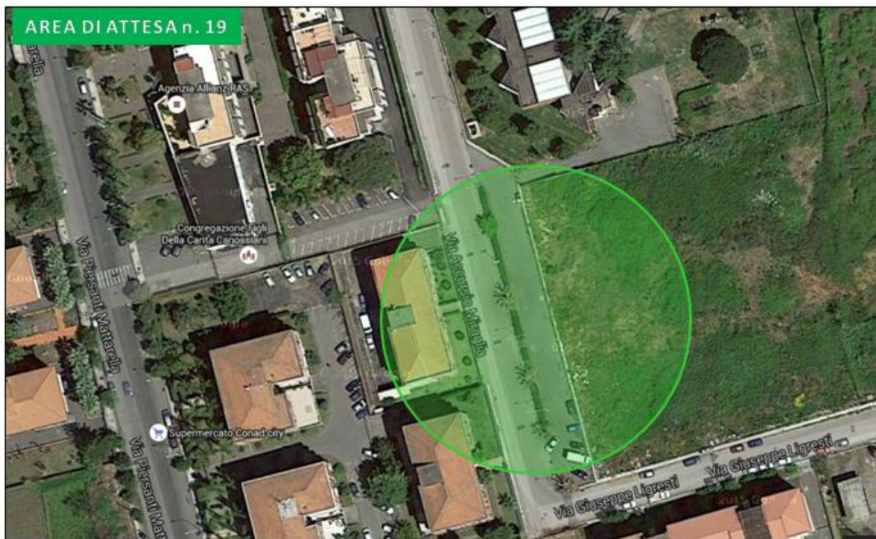
Parcheggio via Miraglia