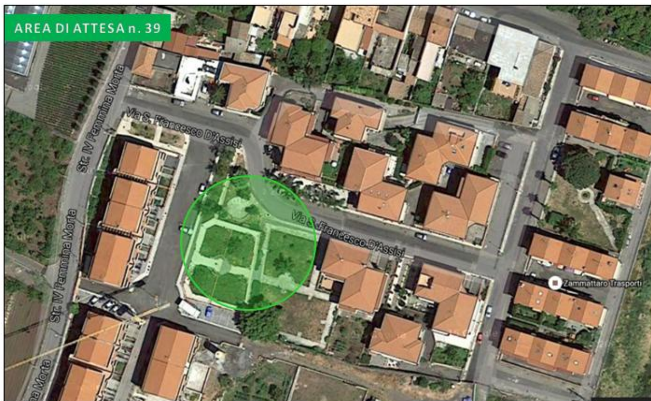
Villetta via San Francesco (Archi)