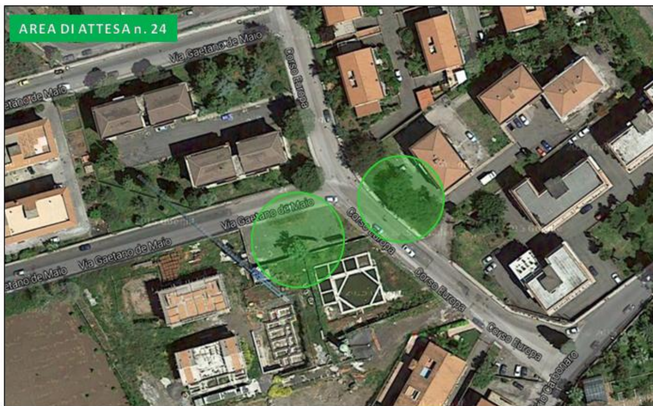
Villette Corso Europa e via Calabretta