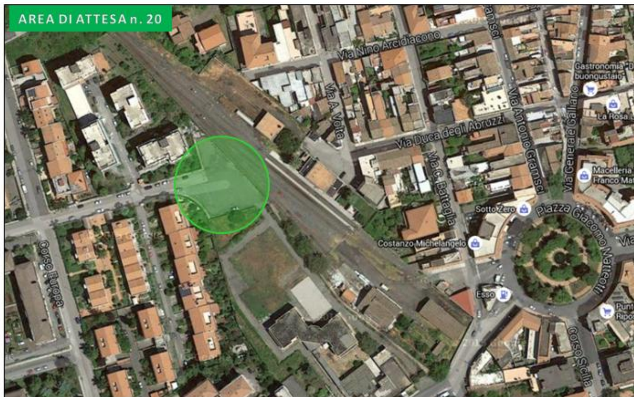
Piazzale Scuola Media via Ligresti