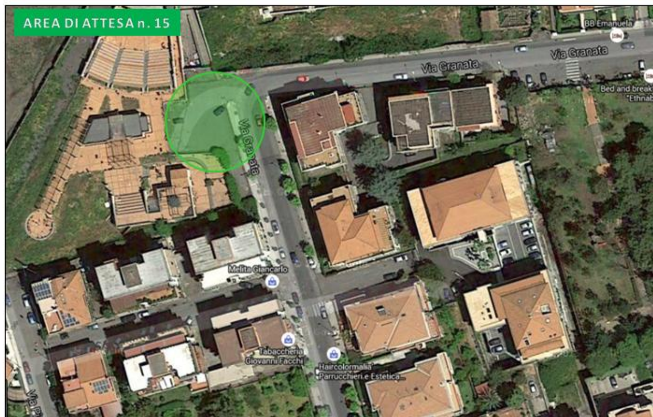
Parcheggio Centro Musicale via Roma