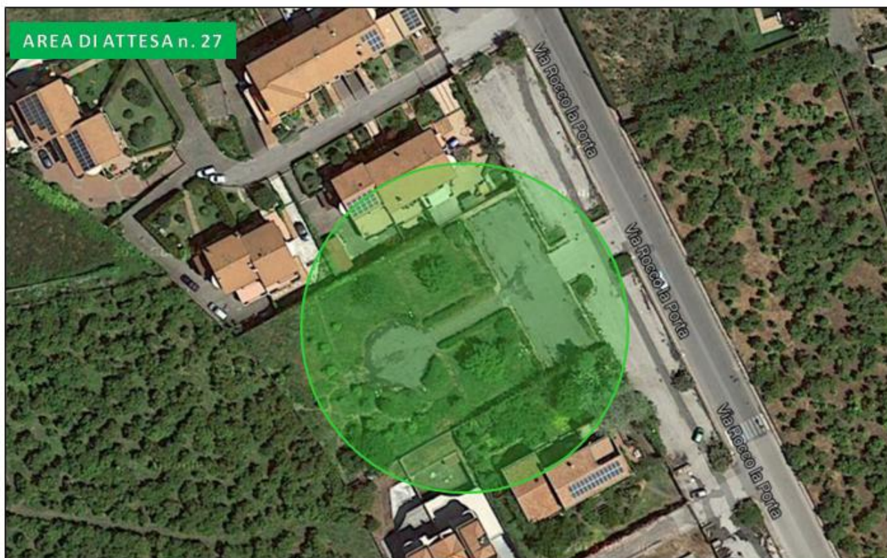
Villetta via Rocco La Porta