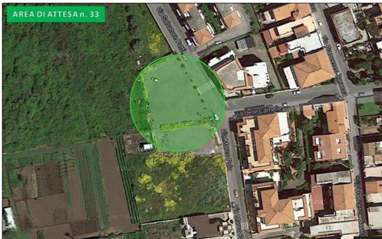
Parcheeggio via Marco Polo (Torre Archirafi)