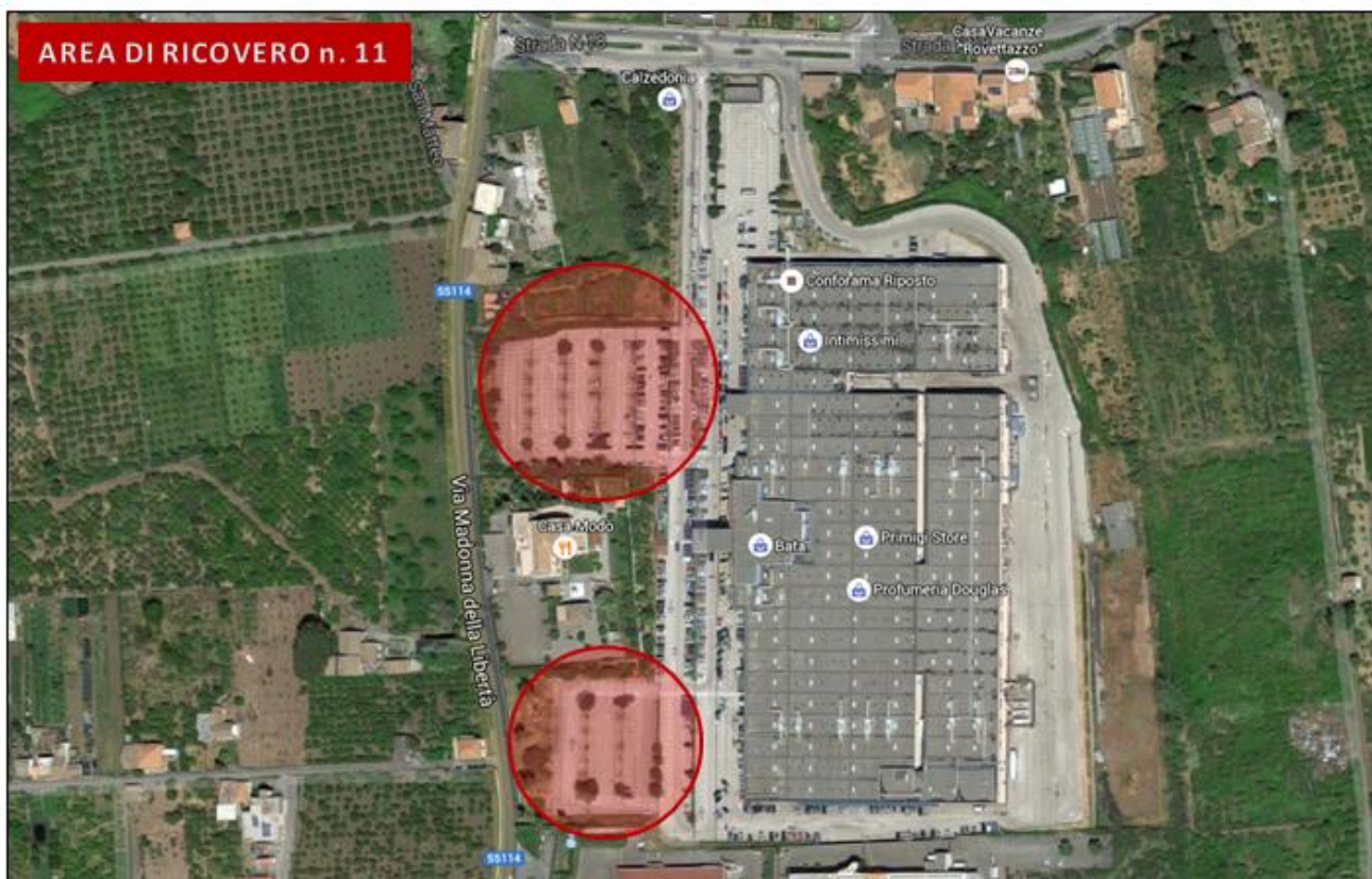
Parcheggio centro commerciale "Conforama" (Rovettazzo)