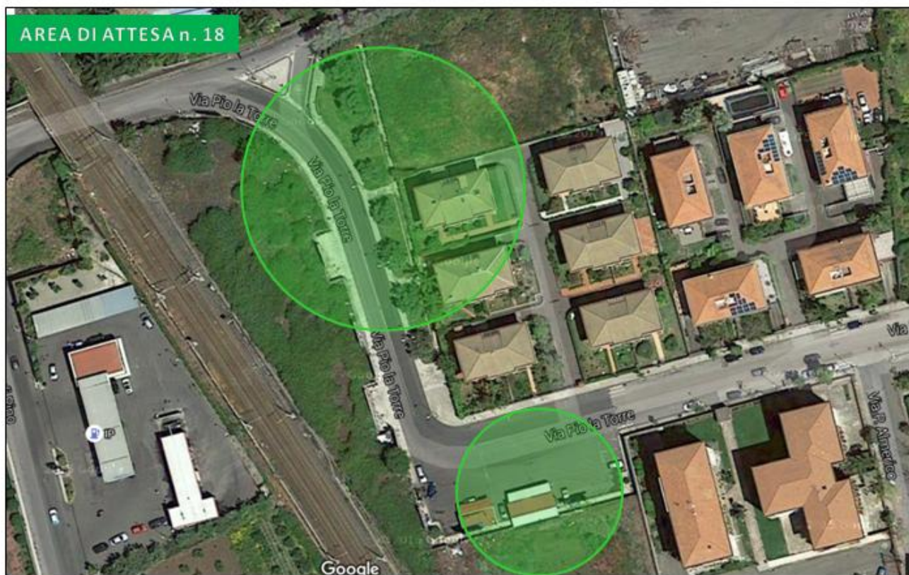
Largo Pio La Torre