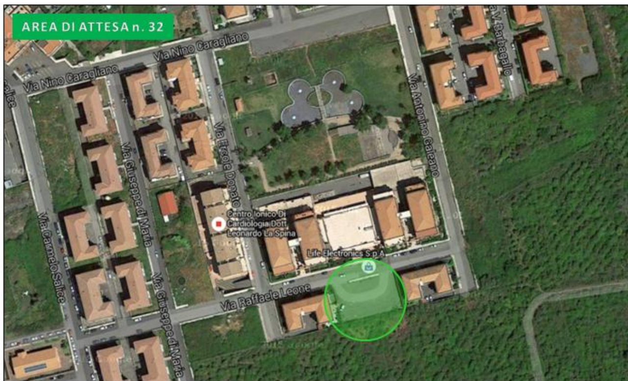
Parcheggio via Raffaele Leone - parco Mattarella sud