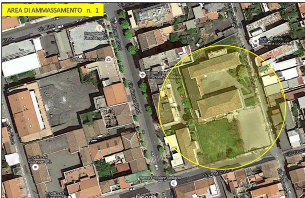
Posteggio e scuola via Concordia