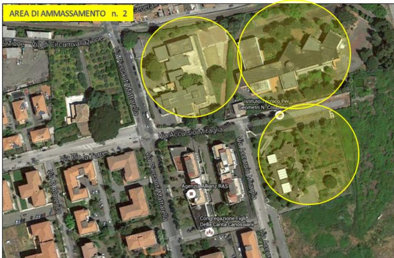
Istituto Tecnico per Geometri - Asilo Nido – Scuola L. Pirandello